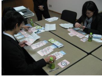
新卒採用の選考プロセスで