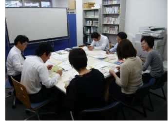
組織内コミュニケーション研修で